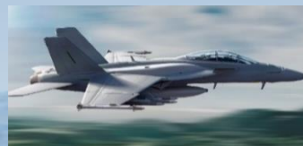
F/A-18 Super Hornet (Boeing)