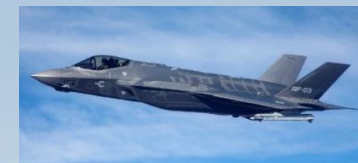
F-35A (Lockheed Martin)